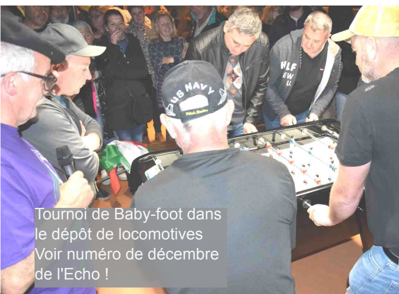
Tournoi de Baby-foot dans le dépôt de locomotives Voir numéro de décembre de l'Echo !