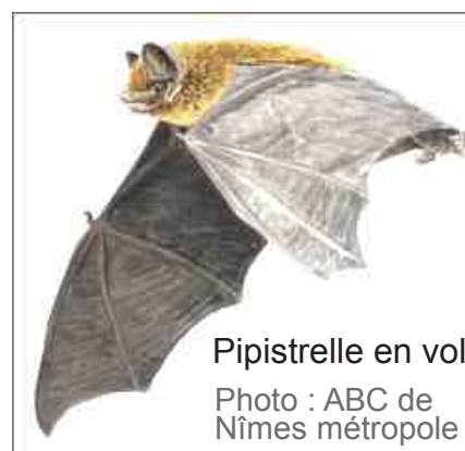
Pipistrelle en vol

Enfin, en début de soirée, certains se sont retrouvés et ont pu entendre, grâce au dispositif qui rend les ultra-sons audibles en les transformant en fréquences plus basses, les chauves-souris qui volent dans les rues du village. Plus de 10 espèces ont été détectées ainsi !