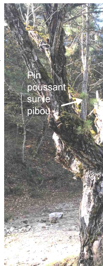
Pin poussant sur le pibou