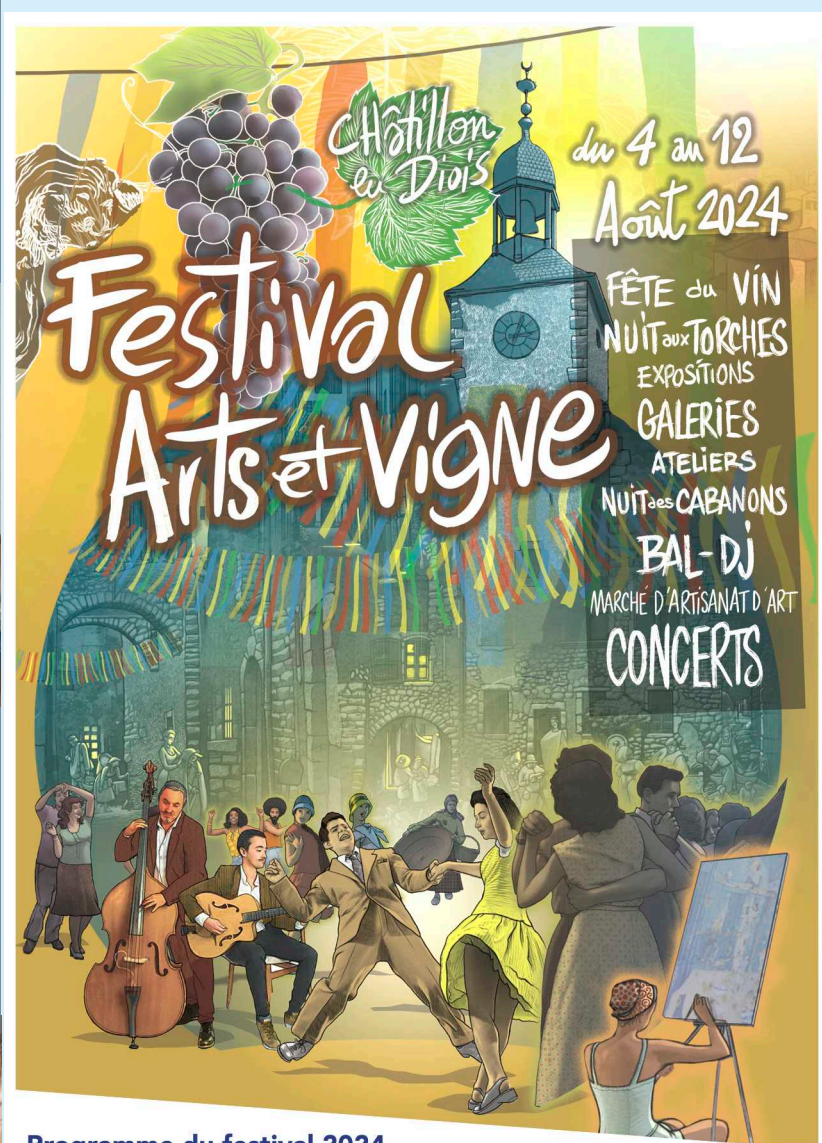
Programme du festival 2024

Ouverture du bureau du Festival, 3 rue du Reclus